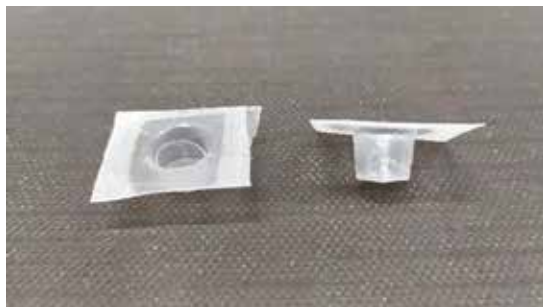
Figura 1 – Suporte de amostra confeccionado com formato de copo.

O suporte de amostra (Figura 1) foi confeccionado aquecendo-se um filme de polipropileno (PP) até que fosse possível moldá-lo no formato de copo, com aproximadamente 1,2 cm de diâmetro e 0,5 cm de profundidade.