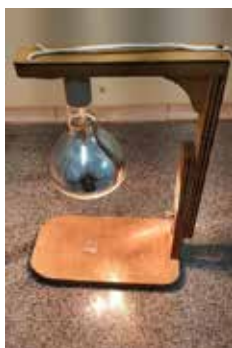
Figura 2 – Eliminação da fase líquida da amostra utilizando uma lâmpada de infravermelho.

Para a avaliação de desempenho do método de preparo foram analisadas amostras de urânio e de tório de 3 diferentes rodadas do PNI do IRD/CNEN. Soluções diluídas de urânio e tório preparadas a partir de soluções padrões para