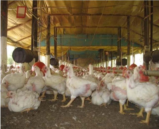
Fig. 1. Imagem de frangos criados sobre o material utilizado como piso (cama de frango composta de maravalha de madeira)

tempo de criação, número de lotes criados no mesmo piso, número de aves por metro quadrado, tempo de estocagem [10], tipo ou composição da ração, temperatura do ambiente e utilização de equipamentos de resfriamento [11]. A produção anual da cama de frango no Brasil pode ser estimada em 3 milhões de toneladas, considerando que um frango de corte produza 1,5 kg de esterco durante o período de criação (49 dias), adicionando-se ainda o peso do material utilizado como piso [10]. Na Fig. 1 apresenta-se uma imagem de frangos criados sobre o material utilizado como piso.