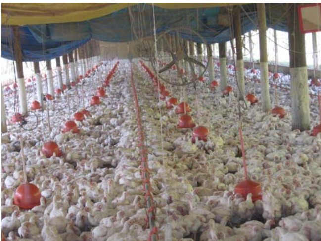
Fig. 2. Imagem de um sistema produtivo de frango de corte.

A amônia que se desprende da cama de frango afeta a saúde animal como irritante de mucosas dos olhos e das vias respiratórias, comprometendo o funcionamento do sistema mucociliar das vias levam a um quadro comum a aerossaculite [8]. Altos níveis de amônia podem ser observados no início da criação, em galpões que reutilizam a cama [12]. Isto se torna um agravante devido à alta população de aves encontradas em um sistema produtivo de frango de corte, como apresentado na Fig. 2.